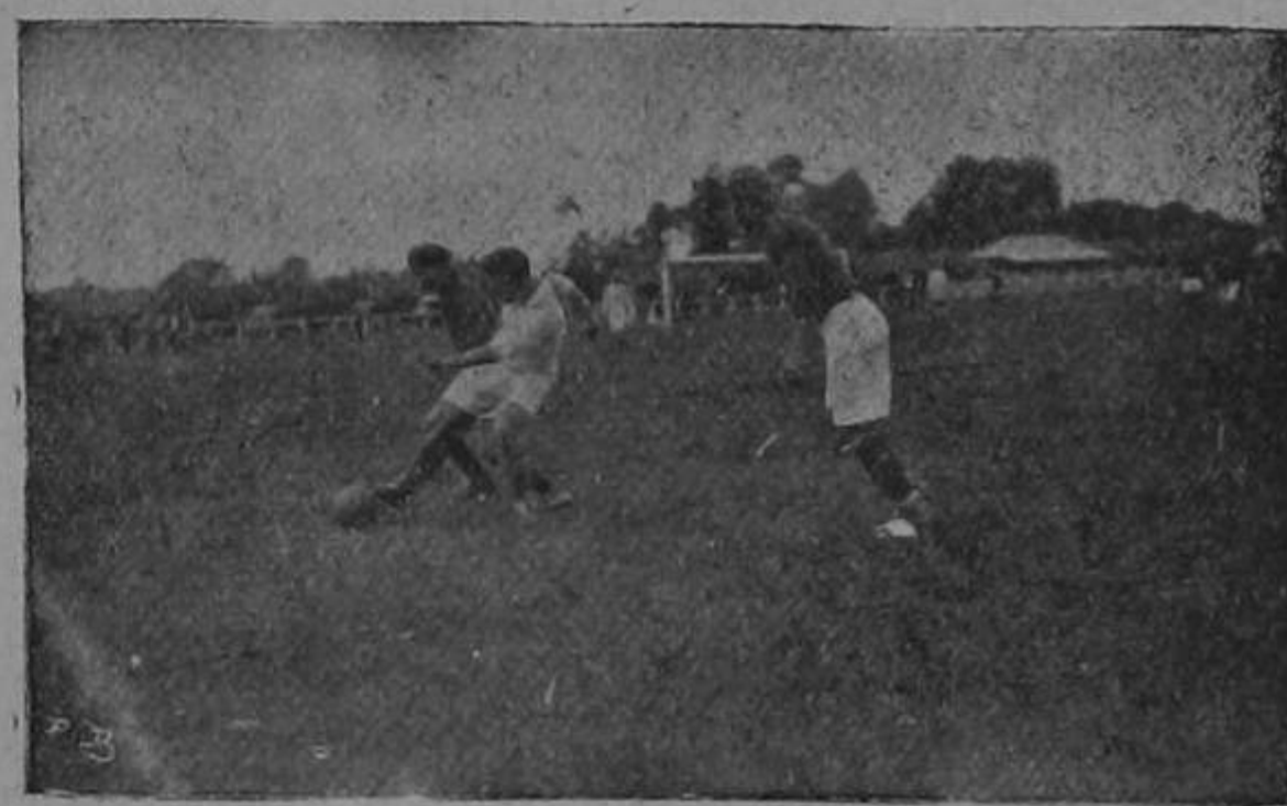
Un emocionante lance del juego de campeonato