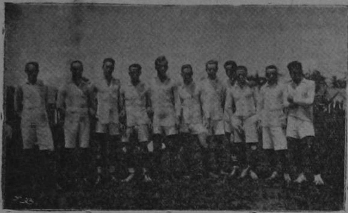
EQUIPO HERCULES DE GUATEMALA