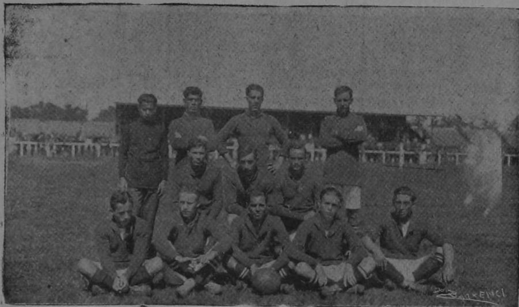
EQUIPO COSTA RICA - Campeón centroamericano de Foot-Ball

Esta copa le fué entregada al Equipo "Costa Rica" después del sensacional match jugado el domingo 18, en que se decidía el